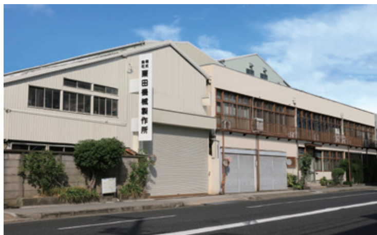
株式会社 栗田機械製作所