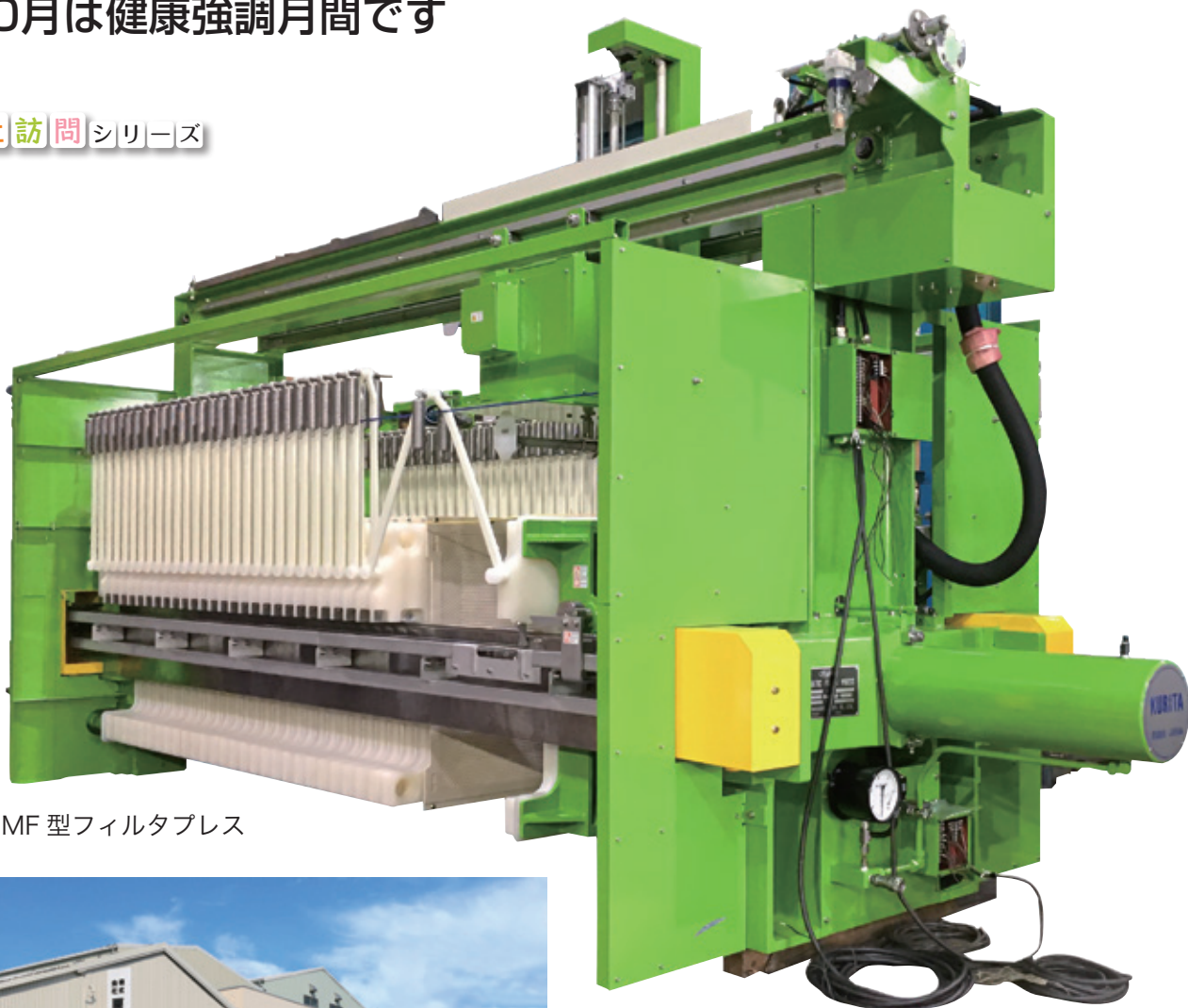
HJMF 型フィルタプレス