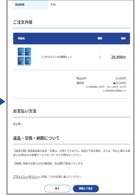
⑩最終確認をして 注文完了 ※組合員資格が無い 方はキャンセル となります。