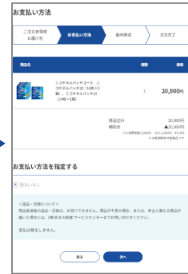
⑨支払方法を選択 ※個人のお支払いは ありません