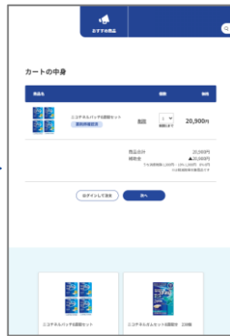
③注文したい商品を カートに入れる