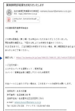
⑦問診結果のメールが 届くので、確認URL より再度購入ページ にアクセス