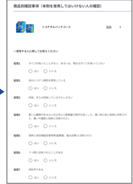
⑤申込者情報の入力 と使用者状態を 確認する質問に回答