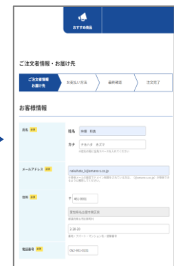
⑧商品お届け先等の 情報を入力