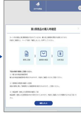
④第1類商品の 購入手続を確認