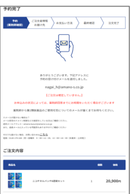
⑥薬剤師にて入力内容 を確認 ※この時点ではまだ注文 は確定していません