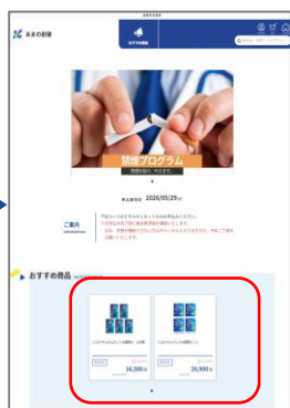
②トップ画面中部の 「おすすめ商品」 から商品を選択